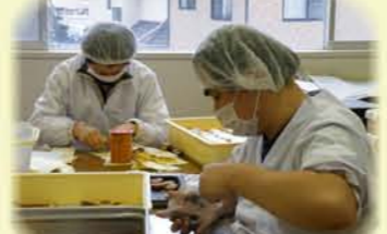
心を込めて作りました