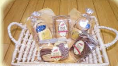
甘すぎない上品な味(1袋300円) 贈答用セットも人気です